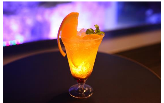
「ほたるのひかりカクテル」

※アルコールの入っていない「ほたるのひかりジュース」(600円税込み)も販売いたします。