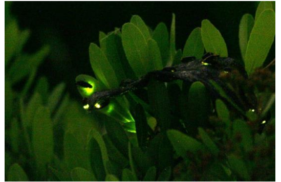
ヘイケボタルの発光

すみだステージで小さなボトルに入ったホタルを展示します。夜の水族館でラグに座ってゆったりとリラックスしながら、柔らかな光を放つホタルを自分の手元で間近に眺めることができます。